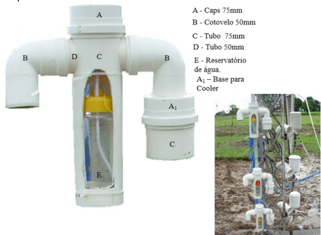
Figura 1 - Psicrômetro de ventilação forçada e local de instalação dos psicrômetros no mastro micro meteorológico na Fazenda Experimental da UFMT.

O psicrômetro de ventilação forçada (Figura 1) foi construído com tecnologia e material relativamente simples, similar a metodologia utilizada por Marin et al. (2001). Utilizou-se tubo de PVC de 50 e 75 mm de diâmetro com 15 e 30 cm de comprimento, respectivamente, dois cotovelos de 50 mm e dois caps de 75 mm de diâmetro. Acoplou-se um “cooler” 12 VDC de forma, que aspirasse o ar do tubo de 50 mm, o qual era ligado para garantir um fluxo de ar constante e a estabilidade das medidas dos termopares de bulbos seco e úmido no momento da leitura (MARIN et al. , 2001; PA; CUNHA; VOLPE, 2014).