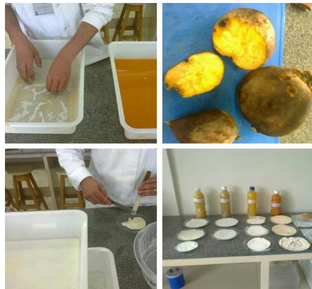
Figura 1 - Processos realizados para extração do amido e suco da batata doce

uma bacia plástica, na qual permaneceu por vinte minutos para decantação do amido. Depois de 20 minutos, o suco foi separado em garrafas plásticas, sendo estas identificadas para caracterização das proteínas. O amido decantado no fundo da bandeja foi retirado com auxílio de espátula de metal, depositado em vidro de relógio, no qual foram pesados, identificados e submetidos à secagem a uma temperatura de 45° C em estufa de ar forçado. Durante o processo de secagem, o material foi pesado de 6 em 6 horas até que adquirisse peso constante por três vezes consecutivas (Figura 1).