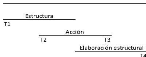
Figura 1. (Archer, 1984a: 8)

las partes, condicionan pero no determinan la interacción social (b). Es decir, (b) surge en parte de las orientaciones de la acción no condicionadas por (a). A su vez (b) conduce a la elaboración estructural (c), al cambio en las relaciones entre las partes. El ciclo luego se repite. La transición de (a) a (c) no es directa, porque el condicionamiento estructural no es el único determinante de los patrones de interacción. El cambio es el resultado de la continua sucesión de estos ciclos. El argumento de que estructura y acción operan en diferentes períodos de tiempo está basado en dos proposiciones simples: que la estructura precede lógicamente a la acción(es) que la transforma(n); y que la elaboración estructural es lógicamente posterior a esa(s) acción(es). Estas interrelaciones temporales se pueden representar como muestra la Figura 1.